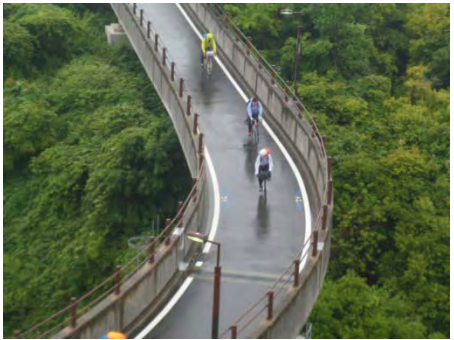
今治駅前ホテルへダッシュ