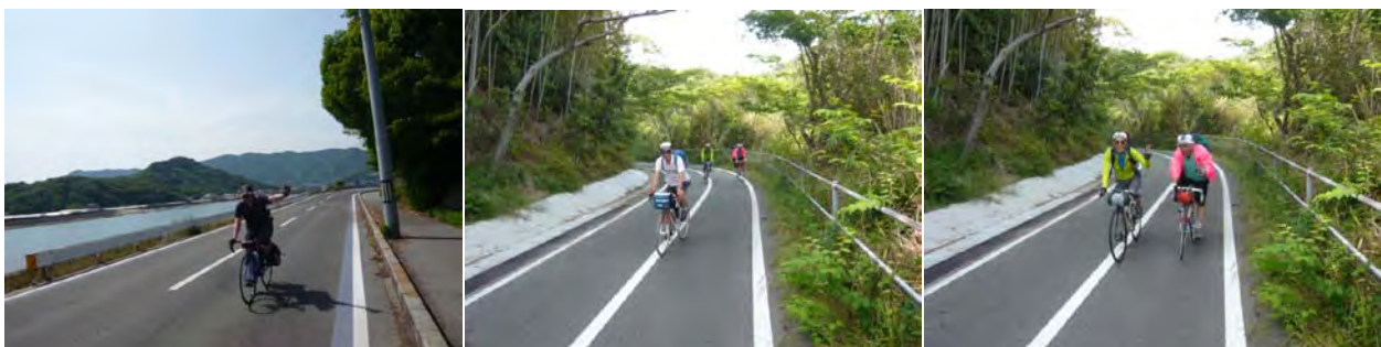
Why? 浅賀君が写っていない 彼は既に先頭で通り過ぎました