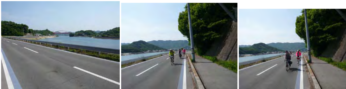
向島大橋 ♪瀬戸は日ぐれて夕波小波♪“これぞ瀬戸内”