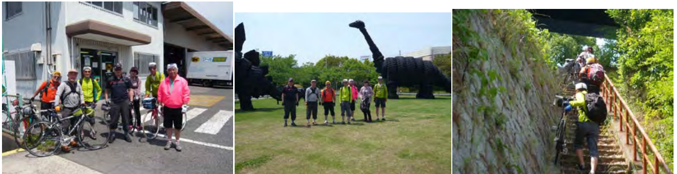
ヤマト運輸尾道で自転車受け取り後出発 横浜ゴム尾道工場内恐竜公園 建設車両用タイヤで製作 尾道大橋へショートカット