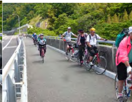
お姉さん達にとってもついていけません