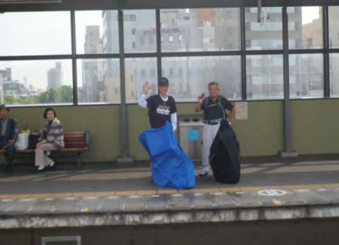
中村、井上君は予讃線瀬戸大橋線経由で帰京