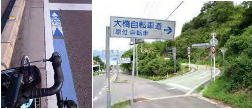
島のいたるところに方向と距離の案内 125cc 以下の原付も走行可