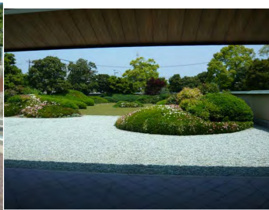
生口島平山郁夫館庭園

「第3回瀬戸内しまなみ海道サイクリング尾道大会」「大三島100コース」「生口島70コース」合計1000人