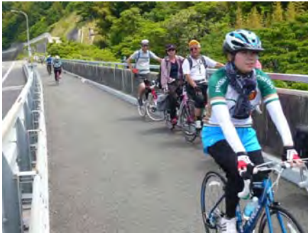
因島大橋 上下二層橋