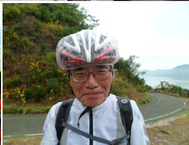
シャワーキャップがかわいい