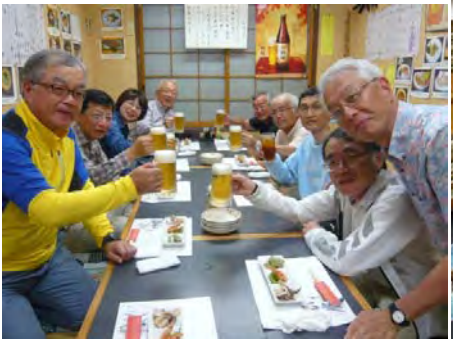
事故もなくお疲れ～え