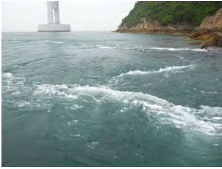
日本三大急潮 来島海峡観潮船より