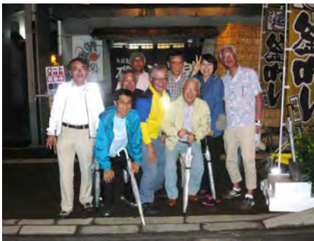
6人のランはここまで